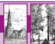
Sönke Schwager Bürgermeister