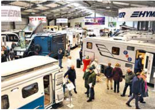
In der großen Ausstellungshalle konnten alle Fahrzeuge von innen und außen besichtigt werden.