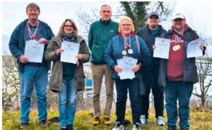
Die erfolgreichen Schützen der Kreismeisterschaft

Für den Schützenverein Rendsburg hätte das neue Jahr nicht besser beginnen können: Bei der Kreismeisterschaft des Kreisschützenverbandes Rendsburg-Eckernförde zeigten die Schützen starke Leistungen und kehrten mit einer beeindruckenden Medaillenbilanz zurück.